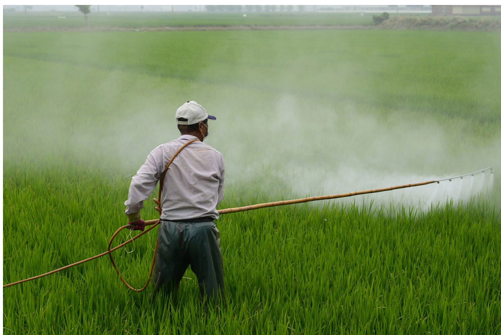
Documentu 1 : fotò di spargjera di pesticidiu cù a mani.