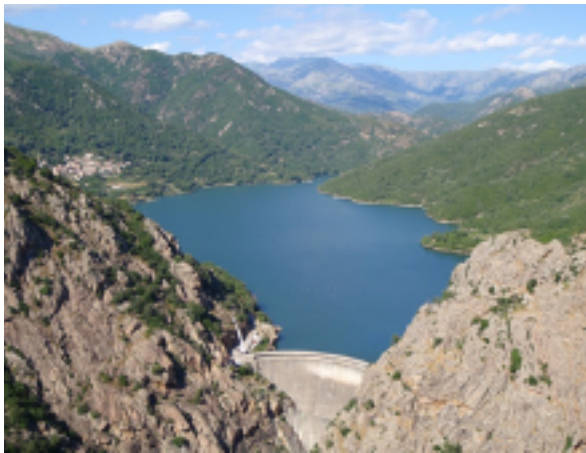
Document 2 : barrage de Tolla.

Ci-dessous, un exemple de paysage et de son croquis :