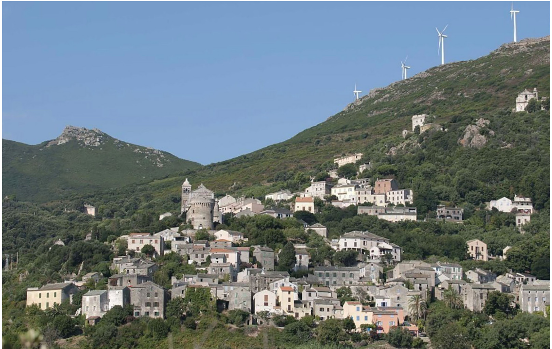
Document 1 : paysage de Rogliano

- pratiquer des langages ; - concevoir, créer, réaliser.