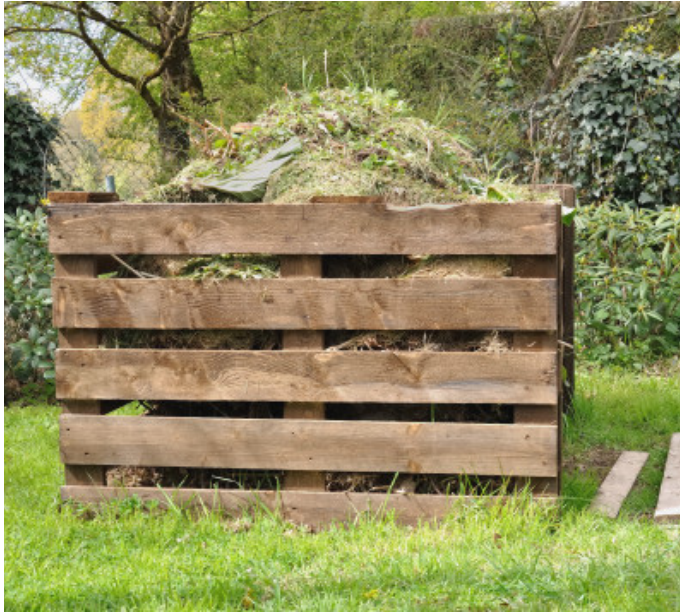
Duc 1 : cumpustadore di legnu carcu à scarti ind'un ortu.