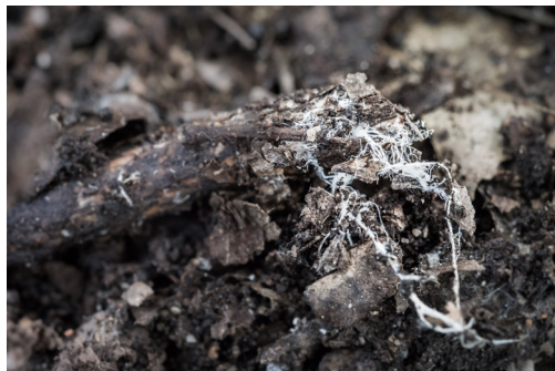
Filamenti di funzi nant'à una cascia.

A tarra tene tamanta quantità di filamenti di funzi è di battèrii micruscopichi, capaci di digerisce in tuttu a materia organica vinuta da l'essari vivi (casce, pisticciuli vegetali, resti d'animali...). A materia di culore neru, chì si vede propiu bè in a tarra, si chjama l'humus : hè materia organica in via di scumpusizione. In fatta fine, quella materia vinarà scumposta sana sana è trasfurmata in elementi minerali. Tandù quelli pudaranu esse assurbiti da i vegetali par pruce a so materia è sviluppà si. Tandù si pò di ch'ellu ci hè un veru riciculu di a materia in a tarra. Battèrii è filamenti di funzi anu bisognu d'umidità pà ripruduce si, sviluppà si è assicurà a so funzione di scumpunitori.